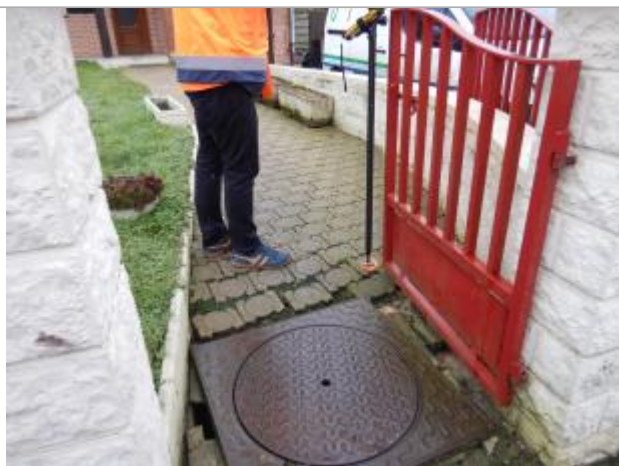
Le repère à ras du sol

Visibilité : Oui État du repère : Moyen Pérennité : Moyenne PHEC : Non