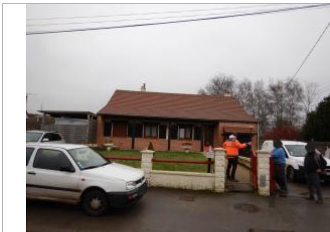
Site à ras du sol.