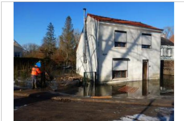
Le site est un poteau en béton