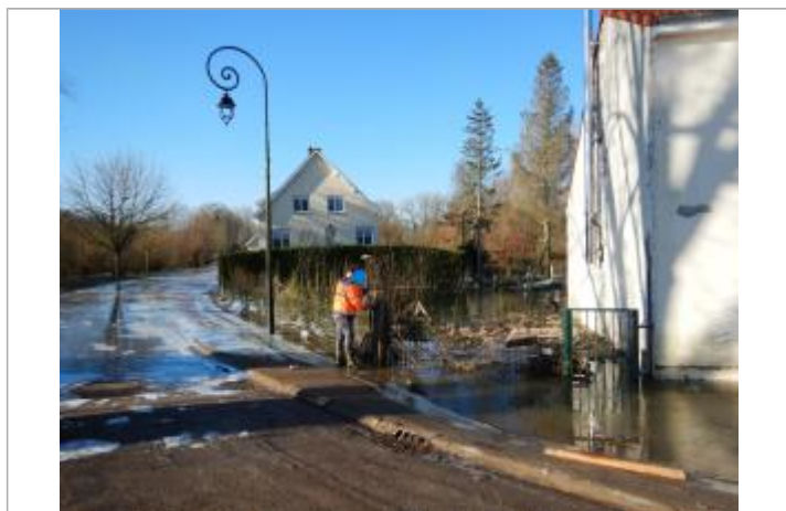
Le repère est au pieds du poteau d'une clôture privée

LE NIVELLEMENT A ÉTÉ RÉALISÉ PAR LE SYMCÉA. LE SYMCÉA N'EST PAS EXPERT GÉOMÈTRE. LA VALEUR RENSEIGNÉE EST DONC À TITRE INDICATIVE. - 11/01/2024