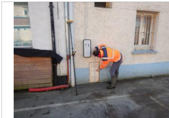
Le repère est sur un coffre électrique.

LE NIVELLEMENT A ÉTÉ EFFECTUÉ PAR LE SYMCEA, QUI N'EST PAS UN EXPERT GÉOMÈTRE. PAR CONSÉQUENT, LA VALEUR INDIQUÉE EST À TITRE INDICATIF. - 11/01/2024