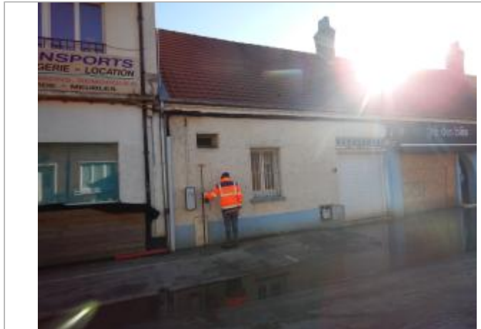
Le site est un coffre électrique

Code Hydro : E54-003- Rive de référence : Droite