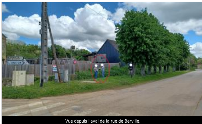
Vue depuis l'aval de la rue de Bréville.