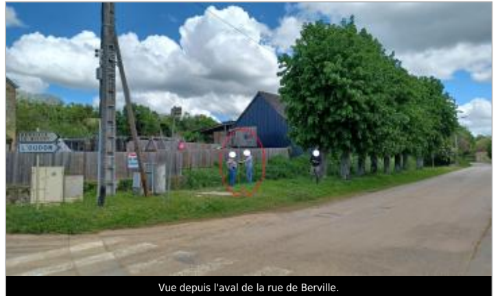
Vue depuis l'aval de la rue de Bréville.