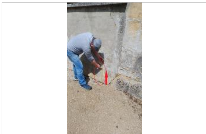
Laisse de crue à 42 cm/sol.

SOURCE DE REPÉRAGE : VISITE DE TERRAIN SPC SACN - 11/03/2020