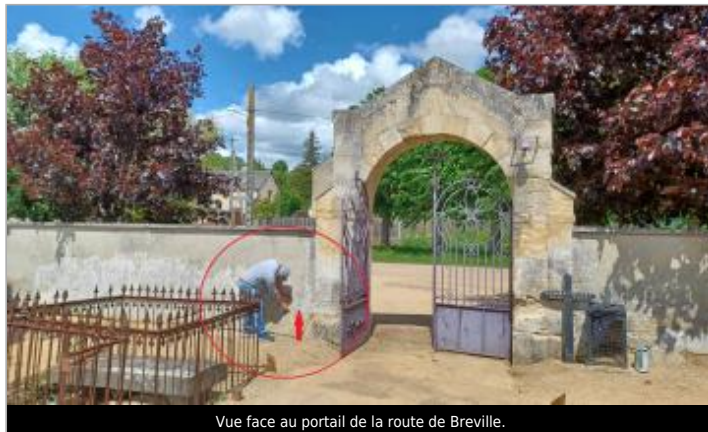
Vue face au portail de la route de Berville.