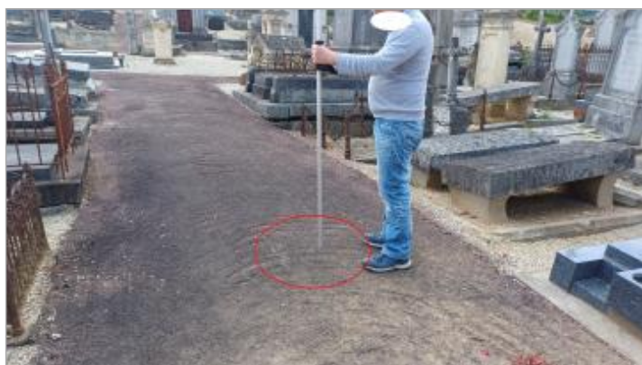
Laisse de crue au sol.

SOURCE DE REPÉRAGE : VISITE DE TERRAIN SPC SACN - 11/03/2020