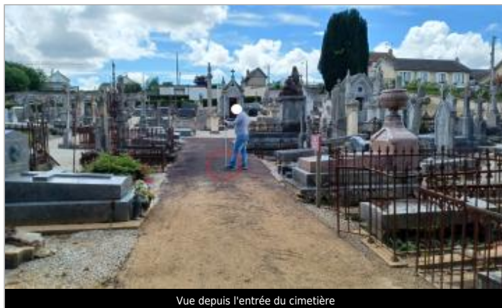
Vue depuis l'entrée du cimetière