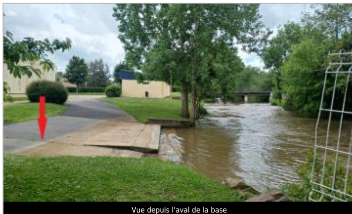
Vue depuis l'aval de la base