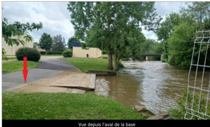
Vue depuis l'aval de la base