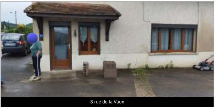
8 rue de la Vaux