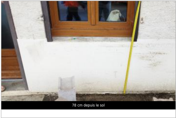
78 cm depuis le sol