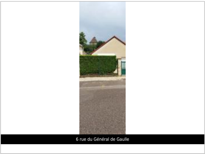
6 rue du Général de Gaulle