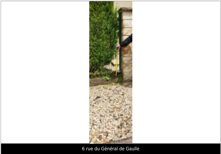
6 rue du Général de Gaulle