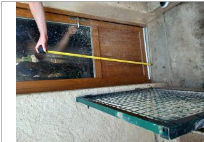
40 rue du Grand Mont