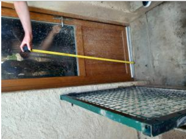
70 cm - Porte arrière de la maison