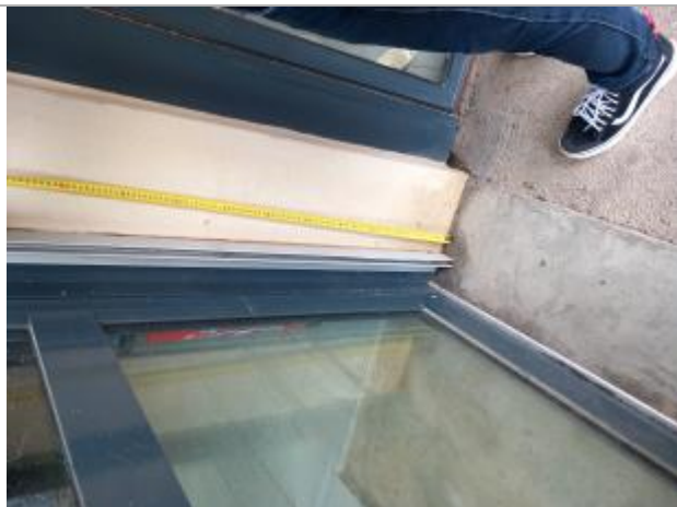
73 cm - Seuil de la porte