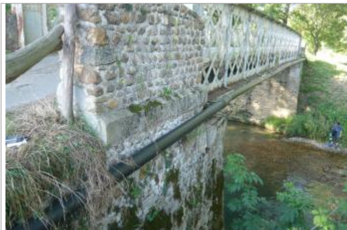
Pont de Clarac (65) sur l'Arros, vu coté amont