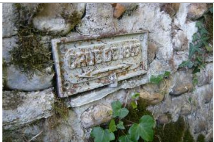
Plaque de la crue de 1897 sur culée amont, rive gauche