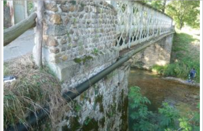
Pont de Clarac (65) sur l'Arros, vu coté amont