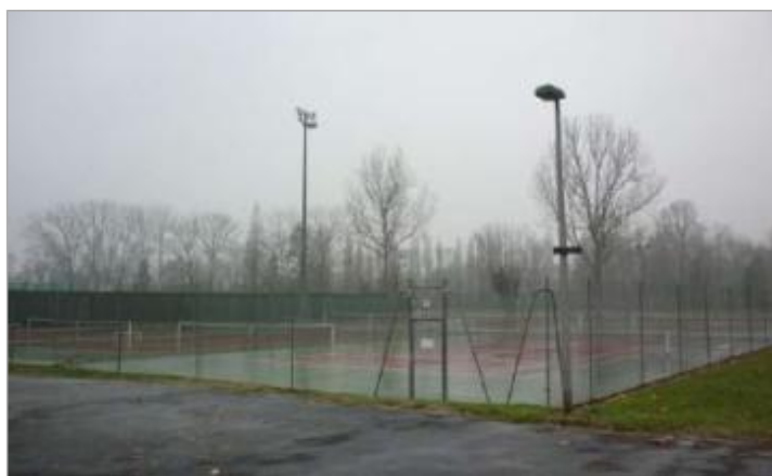
Photo de la laisse ou du repère