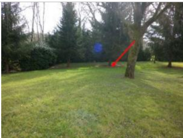
Photo de la laisse ou du repère