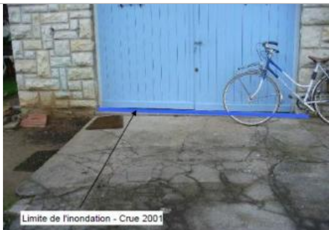
Limite de l'inondation - Crue 2001

Altitude calculée de l'eau (en m) : 105.94 m