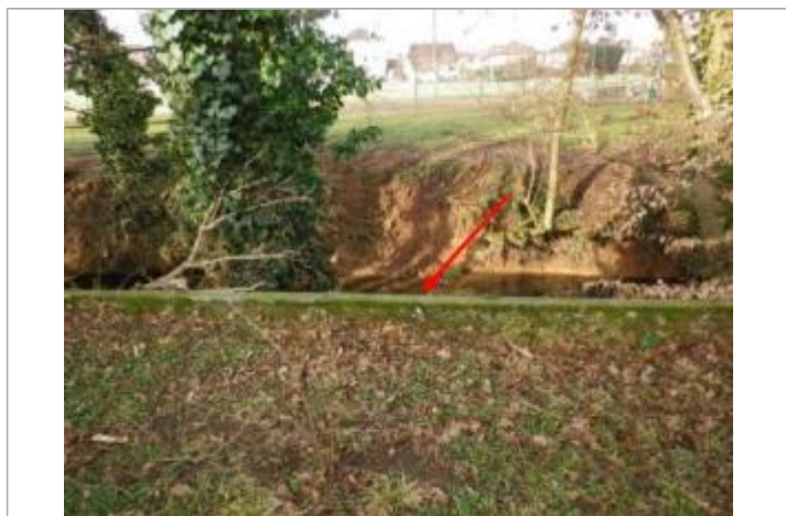
Photo de la laisse ou du repère

Maximum de l'inondation : Oui Visibilité : Non renseigné État du repère : Non renseigné Pérennité : Non renseigné Repère calculé : Non renseigné PHEC : Non renseigné