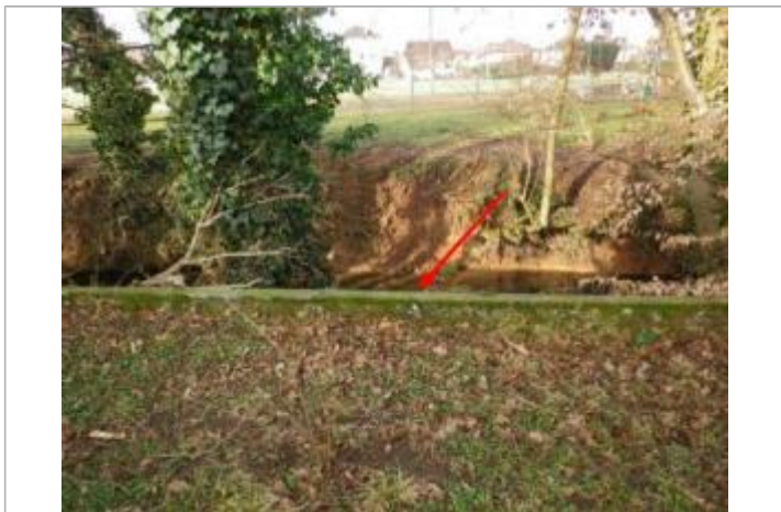
Photo de la laisse ou du repère

Maximum de l'inondation : Oui Visibilité : Non renseigné État du repère : Non renseigné Pérennité : Non renseigné Repère calculé : Non renseigné PHEC : Non renseigné