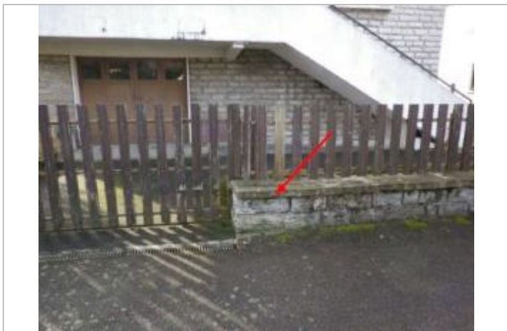
Photo de la laisse ou du repère

Maximum de l'inondation : Oui Visibilité : Non renseigné État du repère : Non renseigné Pérennité : Non renseigné Repère calculé : Non renseigné PHEC : Non renseigné