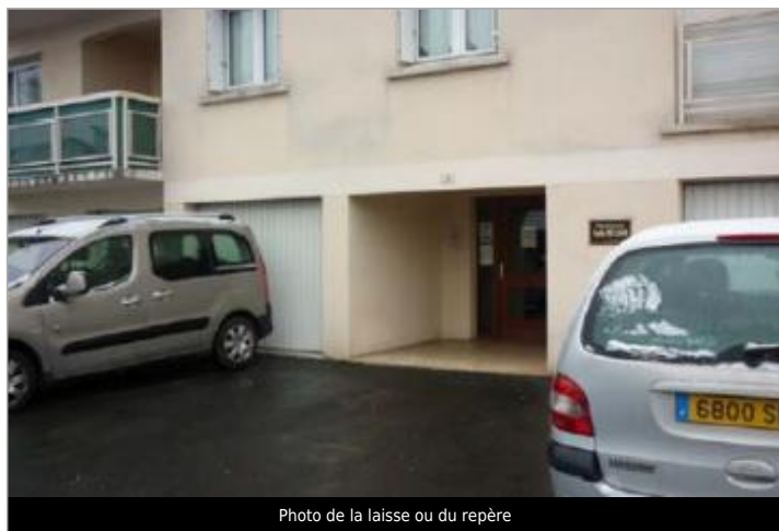
Photo de la laisse ou du repère