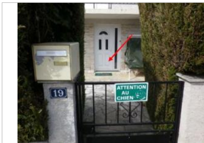
Photo de la laisse ou du repère