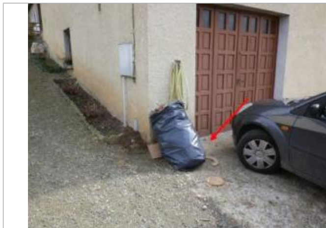
Photo de la laisse ou du repère