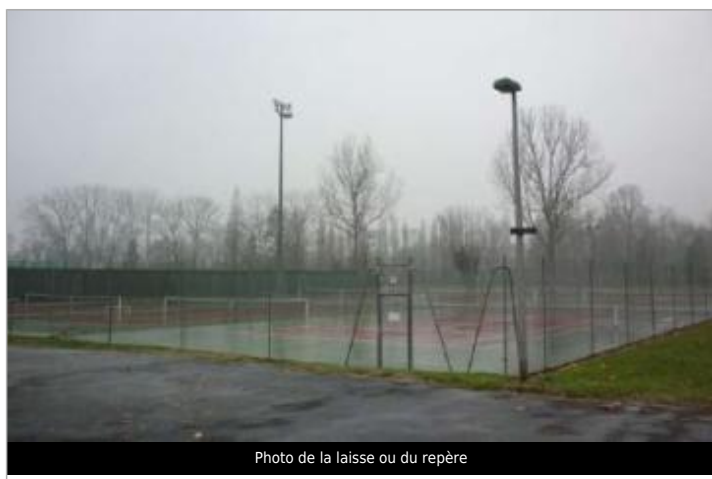
Photo de la laisse ou du repère