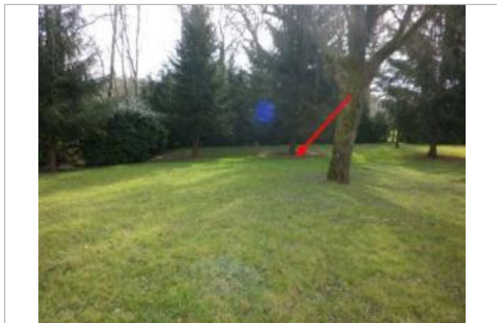
Photo de la laisse ou du repère

Maximum de l'inondation : Oui Visibilité : Non renseigné État du repère : Non renseigné Pérennité : Non renseigné Repère calculé : Non renseigné PHEC : Non renseigné