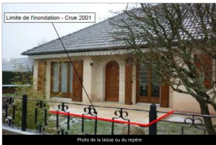
Photo de la laisse ou du repère

Altitude calculée de l'eau (en m) : 116.21