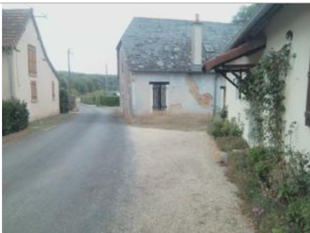
Photo de la laisse ou du repère

Altitude calculée de l'eau (en m) : 91.634