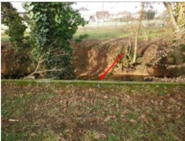
Photo de la laisse ou du repère