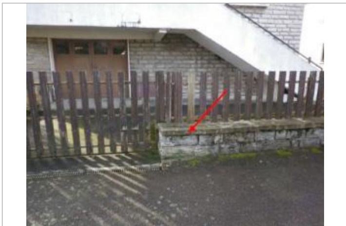
Photo de la laisse ou du repère