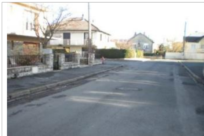
Photo de la laisse ou du repère

Altitude calculée de l'eau (en m) : 106.37