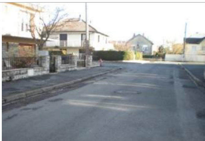
Photo de la laisse ou du repère