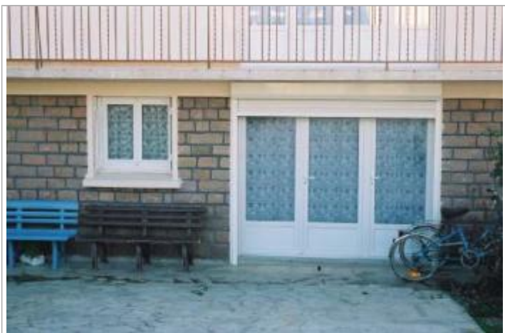
Photo de la laisse ou du repère