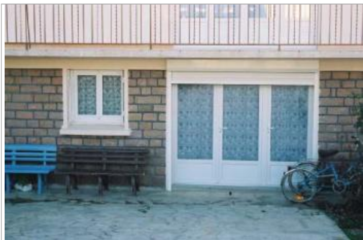
Photo de la laisse ou du repère

Altitude calculée de l'eau (en m) : 120.87