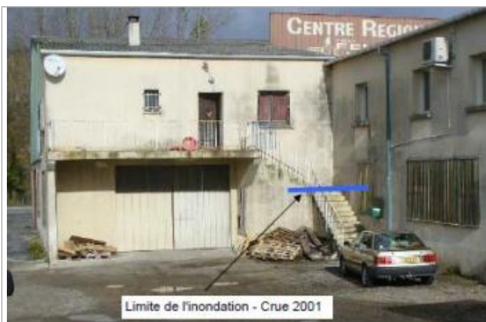
Limite de l'inondation - Crue 2001

Altitude calculée de l'eau (en m) : 106.48