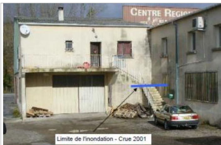
Limite de l'inondation - Crue 2001