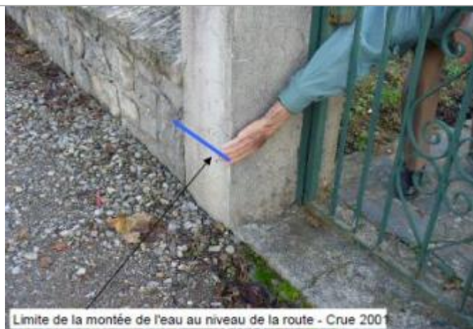
Limite de la montée de l'eau au niveau de la route - Crue 2001

Altitude calculée de l'eau (en m) : 117.28