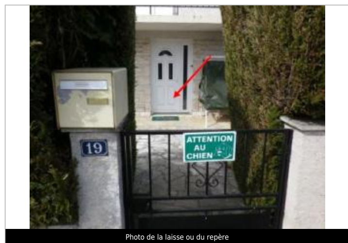
Photo de la laisse ou du repère