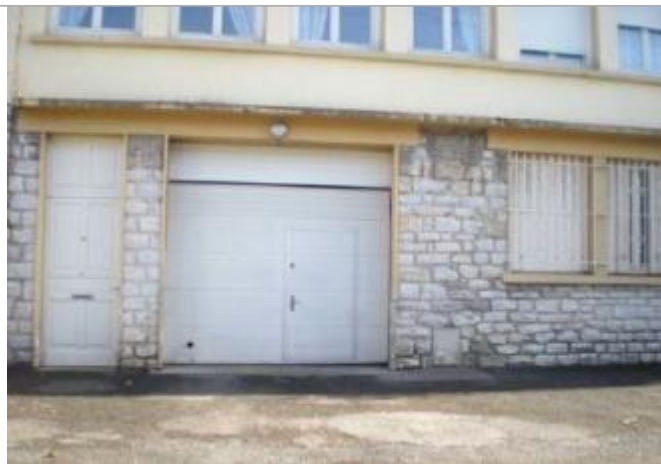
Photo de la laisse ou du repère