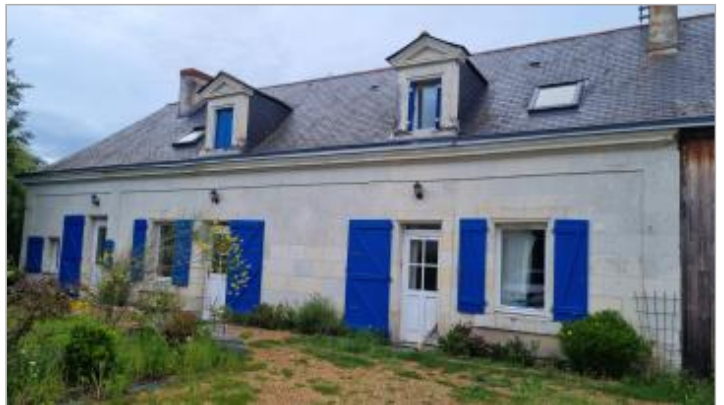
Vue du site n°11 rue des Vendellières, auteur: J. Kuhn, 2024

GÉOLOCALISATION Coordonnées WGS84 : X: -0.27410520 / Y: 47.40754350 Coordonnées RGF93 (Lambert 93) : X: 453160 / Y: 6705917.99 Coordonnées RGF93 (ETRS89) : X: -0.2741052 / Y: 47.4075435 Code Hydro: ----0000 Rive de référence: Droite