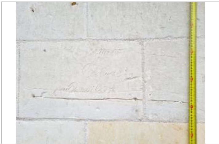
Vue rapprochée de la marque, auteur: J Khun, 2024

MARQUE Texte : Texte peu lisible: "A*** De loire crue de mile 856" Visibilité : Oui État du repère : Mauvais Pérennité : Moyenne