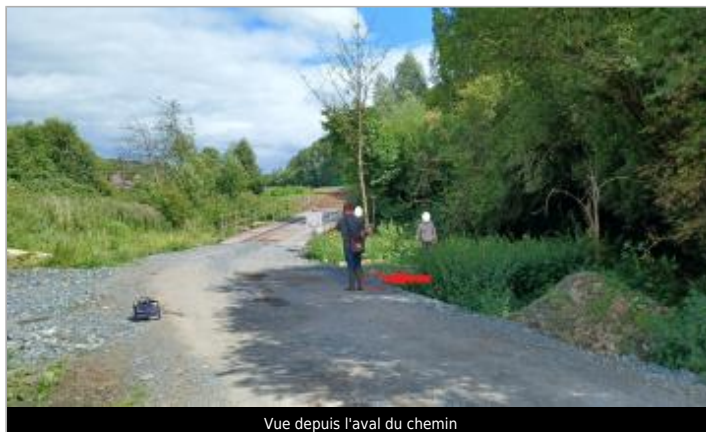
Vue depuis l'aval du chemin