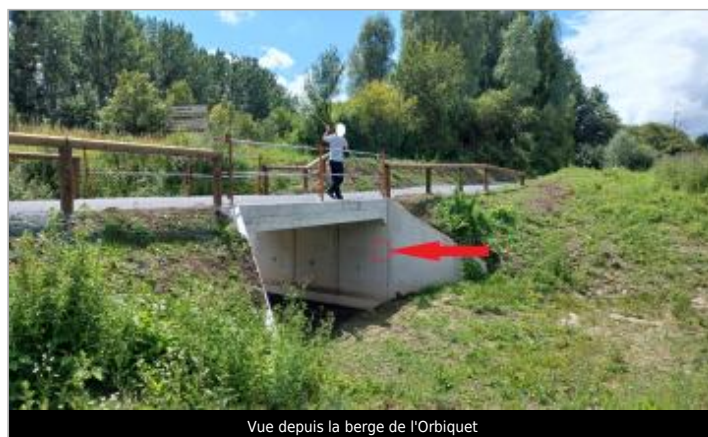
Vue depuis la berge de l'Orbiquet

GÉOLOCALISATION Coordonnées WGS84 : X: 0.24359305 / Y: 49.13434720 Coordonnées RGF93 (Lambert 93) : X: 498871.2 / Y: 6896239.22 Coordonnées RGF93 (ETRS89) : X: 0.2435931 / Y: 49.1343472 Code Hydro: I02-0400 Rive de référence: Gauche