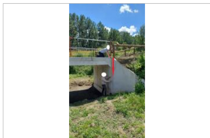
Laisse de crue à 129 cm/haut du pont

GÉNÉRAL Code : WEB_R_202407191115 Date de mise à jour : 19/07/2024 Auteur : SPC.SACN