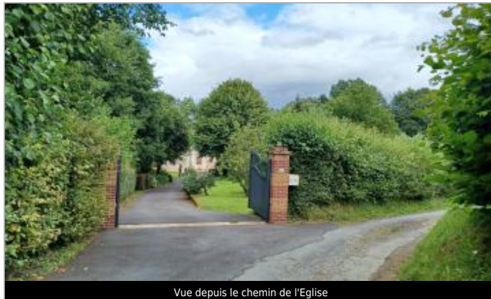
Vue depuis le chemin de l'Eglise