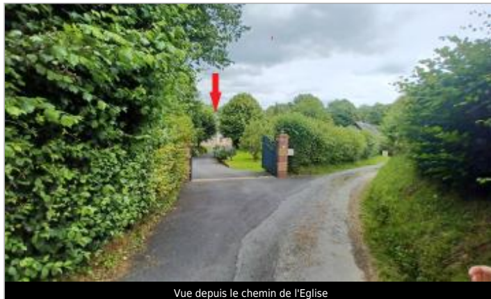
Vue depuis le chemin de l'Eglise