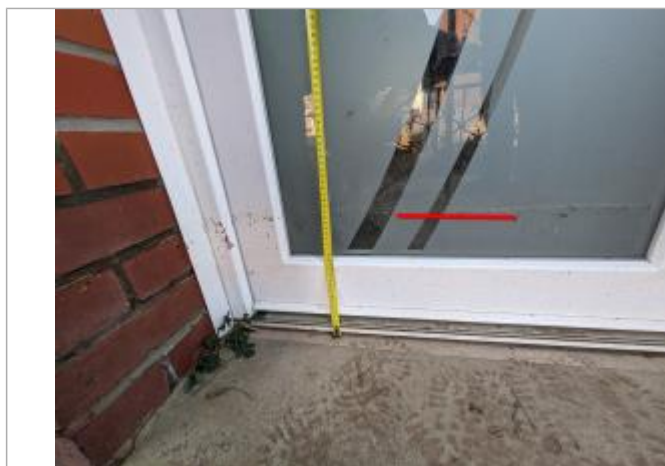
repère sur porte