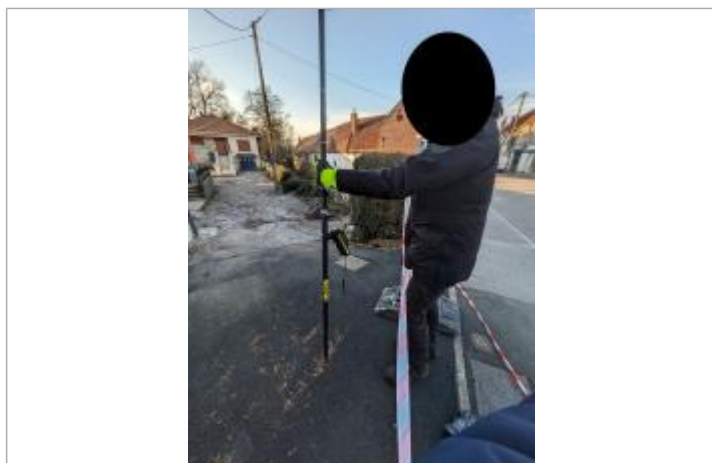
laisse au sol

Altitude calculée de l'eau (en m) : 37.385 m