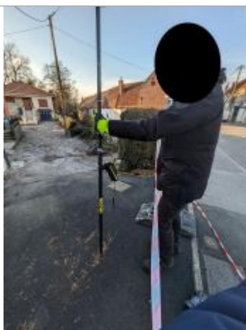
laisse au sol

Altitude calculée de l'eau (en m) : 37.385 m