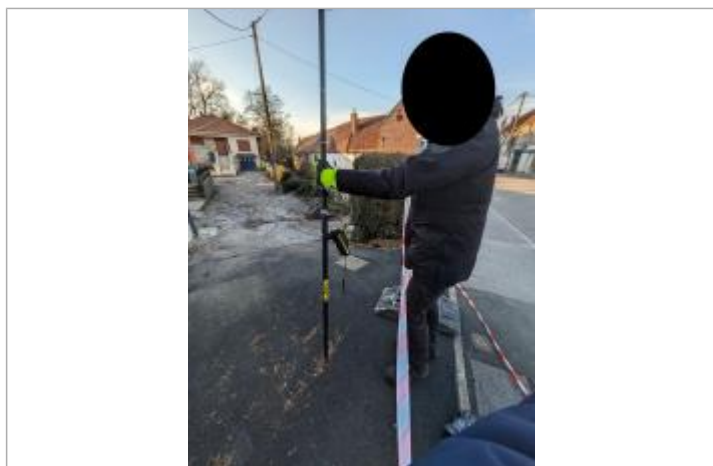
laisse au sol

Altitude calculée de l'eau (en m) : 37.385