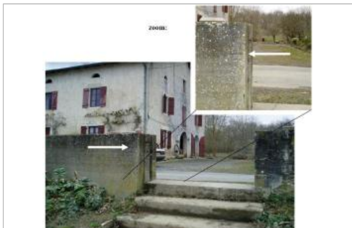
Vue de la laïsse