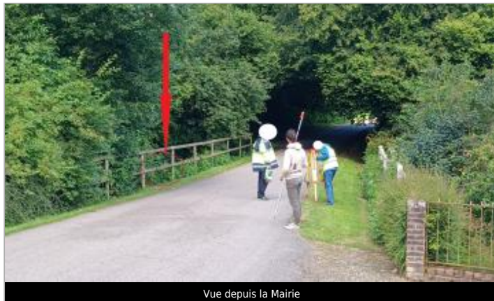
Vue depuis la Mairie

Coordonnées WGS84 : X: 0.17948113 / Y: 49.09338540