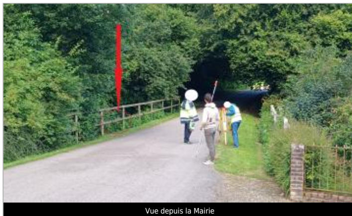
Vue depuis la Mairie