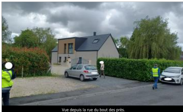
Vue depuis la rue du bout des près.