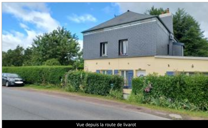
Vue depuis la route de livarot