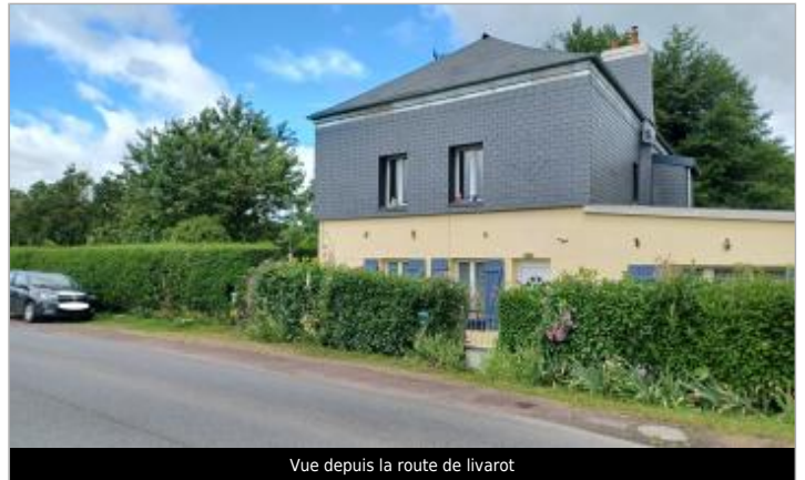
Vue depuis la route de livarot