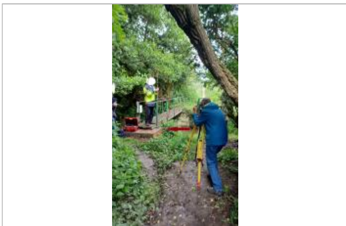
Mesure faite sur la passerelle avec référence altitude sur le support en briques

SOURCE DE REPÉRAGE : VISITE DE TERRAIN SPC SACN - 11/03/2020